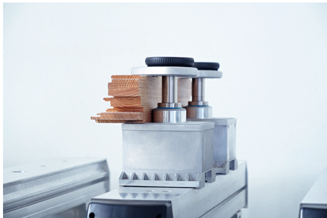
Механический зажим VCMC-K1-QUICK при зажатии деталей рамы

Диапазон зажима от 10 мм до 100 мм с быстрой регулировкой